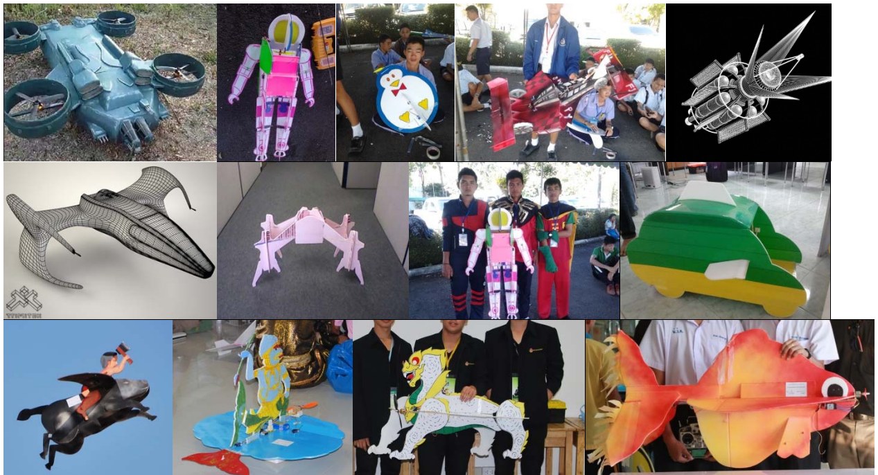
ตัวอย่างการออกแบบและนำเสนอ

อากาศยานความคิดสร้างสรรค์บินประกอบดนตรี หมายถึง การออกแบบและสร้างอากาศยานฯ ขึ้นเอง ตามหลักอากาศพลศาสตร์พื้นฐาน โดยให้ผู้เข้าแข่งขันสร้างอากาศยานฯ ที่จินตนาการมาจาก คน สัตว์ สิ่งของที่เราใช้ในชีวิตประจำวัน เช่น คน การ์ตูน สัตว์ (ที่ไม่ใช่สัตว์ปีก) ผลไม้ ยานพาหนะ เฟอร์นิเจอร์ เครื่องใช้ไฟฟ้า เครื่องใช้ในครัวเรือน เครื่องดนตรี เครื่องประดับ เคหะสถาน โลกอวกาศ ฯลฯ บินแสดงท่าทางการบินตามจังหวะเสียงเพลง